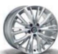
74B / 5ZZ