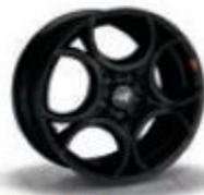
9S5 / 9S1