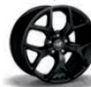
0R4 / 7PD