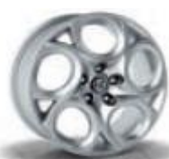
5YN / 5ER