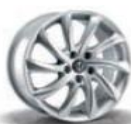
420 / 5EQ