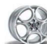
68P / 8CE