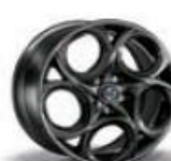
6Y8 / 5EV