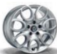
74A / 56J