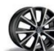
6H6 / 9RZ