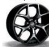
0R5 / 7PN