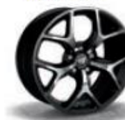
0R5 / 7PN