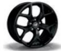
0R4 / 7PD