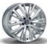
74B / 5ZZ