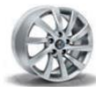
431 / 4AW