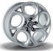
5YN / 5ER