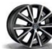
6H6 / 9RZ