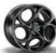
6Y8 / 5EV