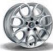
74A / 56J