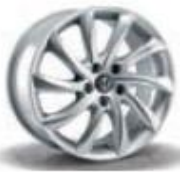
420 / 5EQ