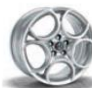
68P / 8CE