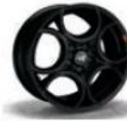
9S5 / 9S1