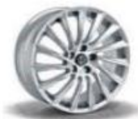
68Q / 9F0